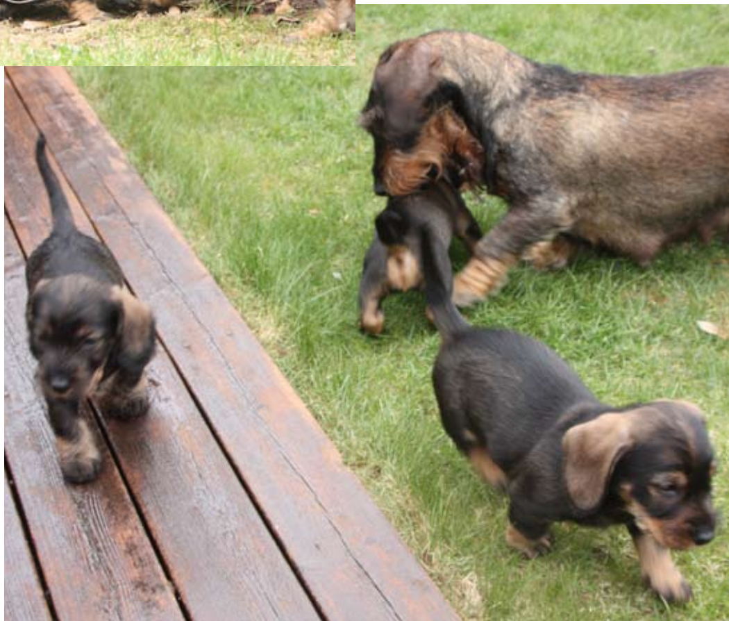
Når podene tar seg til rette i friluft, er mor Tinka rask til å irectesette når ikke alt går etter hennes plan.