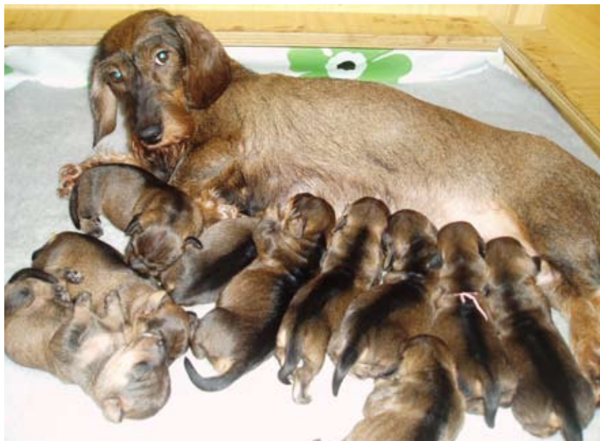
Tinka har fått flere store valpekaukull

– Står du foran et valpekjøp, så sørg uansett for å innhente referanser om kennelen. Ta gjerne kontakt med NKKs jakthundavdeling og avlsrådet hos Norske Dachshundklubbers forbund før du kjøper hund. Betal aldri fem øre før alle papirer og kontrakter ligger på bordet. Merk også at foreldredyr