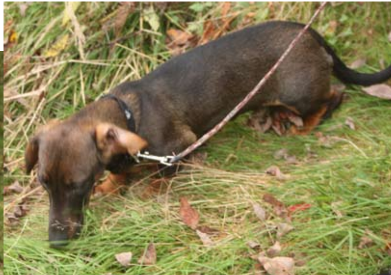
Denne unghunden går på sitt første blodspor etter et nyskutt rådyr. Det er ingen ting å si på innsatsen – og belønningen venter i andre enden ...