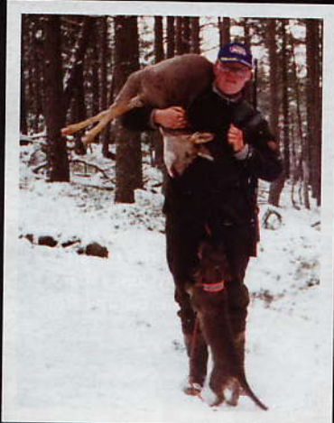
Rådyrfall på en av de første jaktturene etter ulykken.