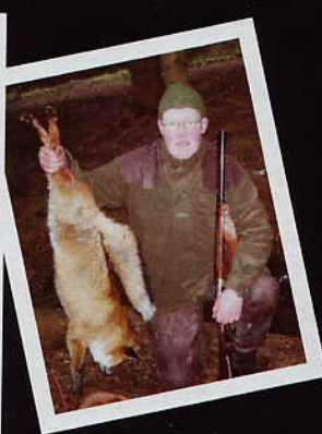
Fra en vellykket revejakt i Sverige.