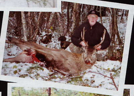
På hjortejakt på Vestlandet etter ulykken med hunden Wojteks Alfa.