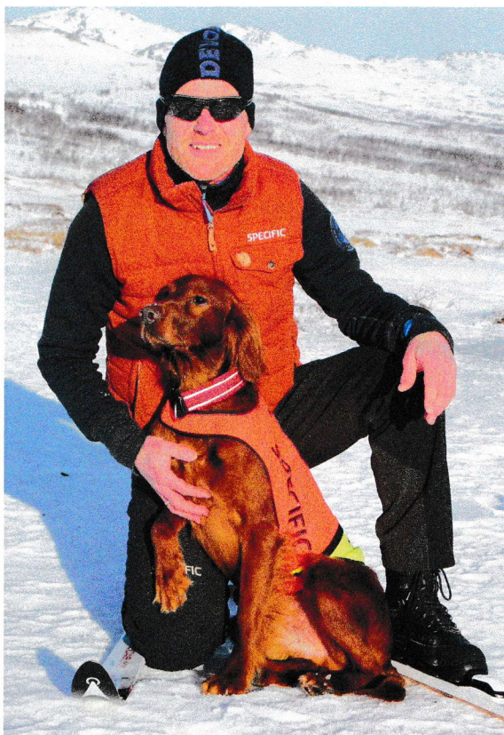
Irsk setter Imingens Pr Prince er en fuglehund av en klasse som det er de færreste forunt å få oppleve.